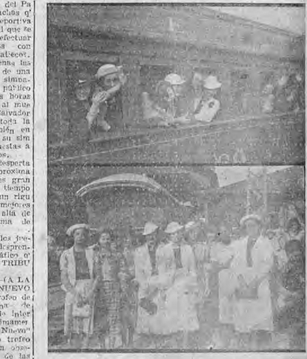
Recoge la cámara de Casillo dos aspectos de la partida de las simpáticas basketballistas costarricenses ayer en la estación del Pacifico a donde fué a despedirlas gran cantidad de admiradores.

SAN SALVADOR, 4.—(A LA TRIBUNA.—DIARIO NUEVO) obsequiará un bellissimo trofeo de plata a selección femenina de basket ball que gane serie internacional efectuada próximamente esta capital. "Diario Nuevo"